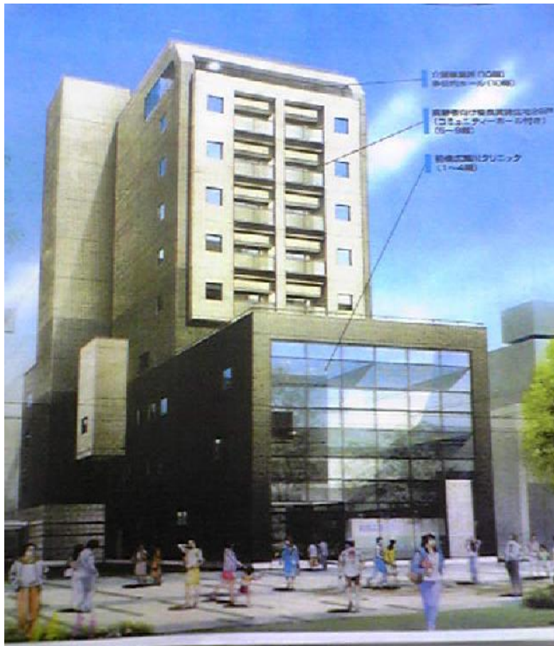
ノ・メゾン広瀬川（前橋市千代田町）