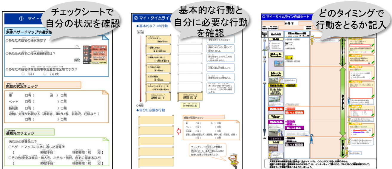
出典：群馬県HP「マイ・タイムライン(個人の避難行動計画)」 https://www.pref.gunma.jp/page/11255.html

「マイ・タイムライン」は台風等の接近などにより、災害発生のおそれがある場合に家族構成や生活環境に合わせ、いつ、何をするのかをあらかじめ時系列で整理した住民一人ひとりの避難行動計画です。平時から「マイ・タイムライン」をつくっておくことで、いざという時に落ち着いて行動することができ、自分や家族の命を守ることにつながります。