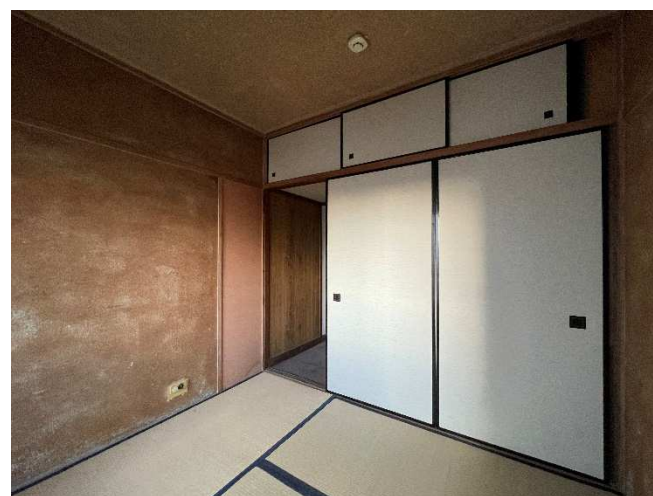
押し入れ(南西和室 4.5帖)