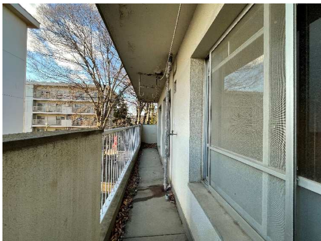
洗濯機置場・ベランダ