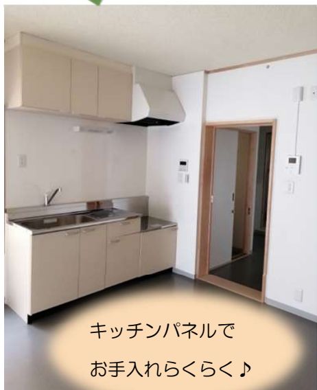
キッチンパネルで お手入れらくらく♪