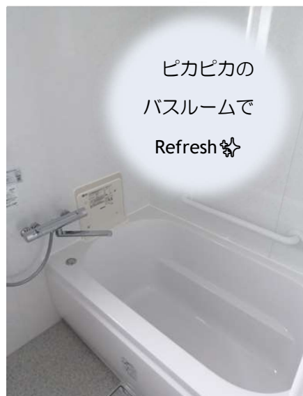
ピカピカの バスルームで Refresh