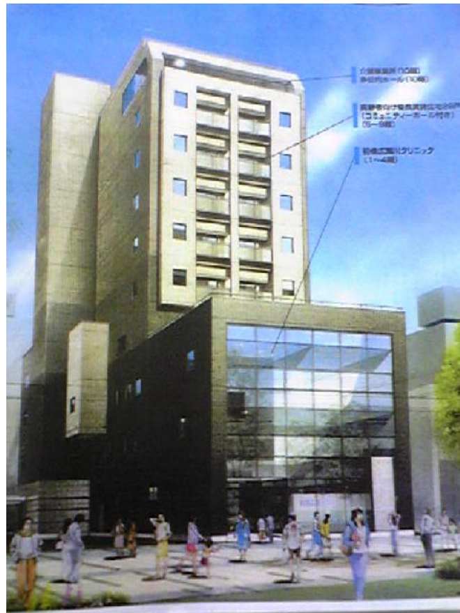
ノ・メゾン広瀬川（前橋市千代田町）