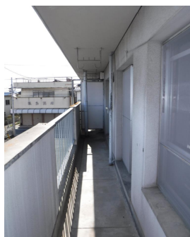
ベランダ・洗濯置き場