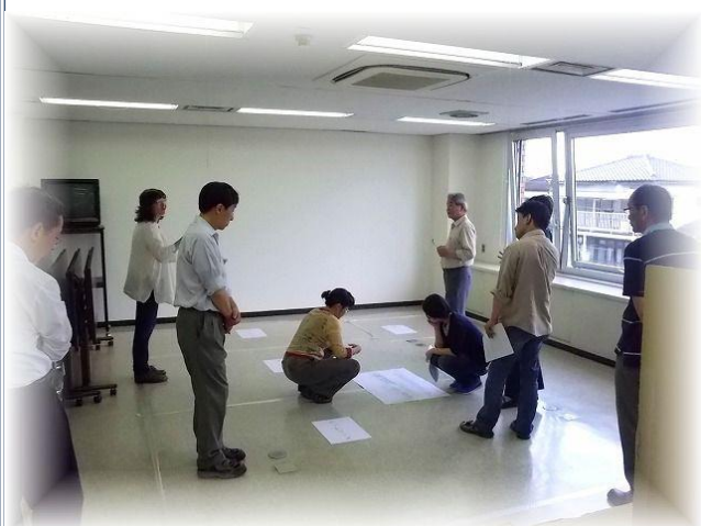
第5回ワークショップの様子(平成24年6月開催)

風除室、エントランスの配置について、床にビニル紐で壁位置を原寸表示し、位置関係等を検討しました。