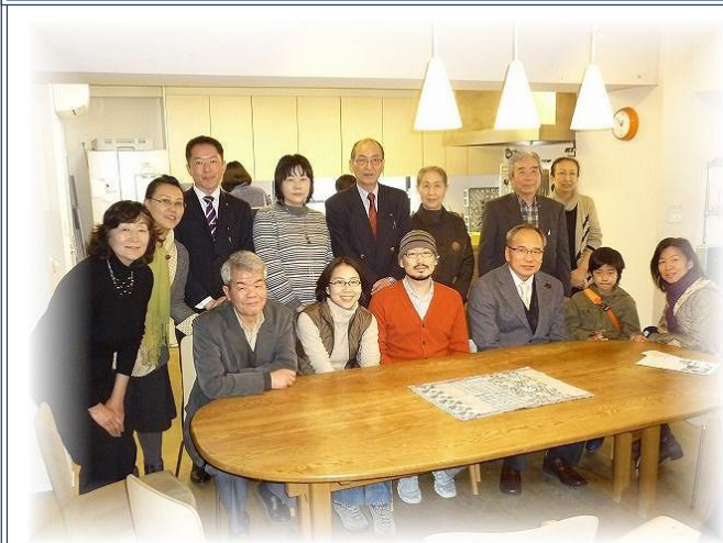
コレティブハウス見学会の様子②(平成24年3月開催) 巣鴨フラットへ見学に行きました。