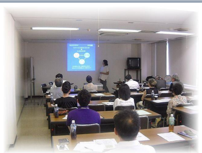
コレティブハウス説明会の様子 (平成23年9月開催)