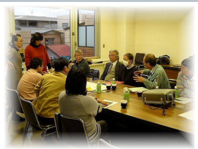
第3回ワークショップの様子(平成24年1月開催) コモンスペースの使い方と家を豊かに使う暮らしについて、検討しました。