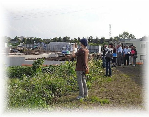
第6回ワークショップの様子(平成24年6月開催)