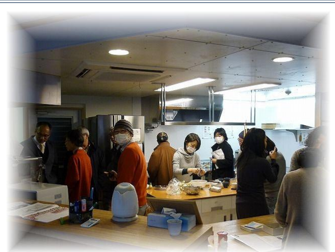
コレティブハウス見学会の様子①(平成24年3月開催) コレティブハウス聖蹟へ見学に行きました。