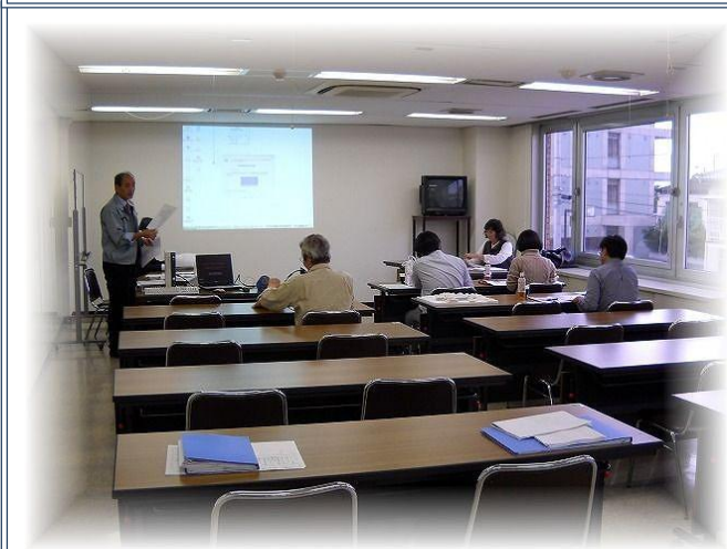
コレティブハウス説明会の様子 (平成23年10月開催)