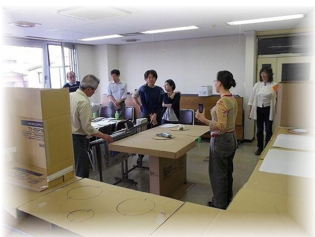
第5回ワークショップの様子(平成24年6月開催)