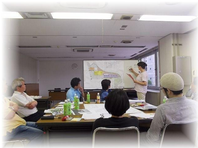
第7回ワークショップの様子(平成24年7月開催)